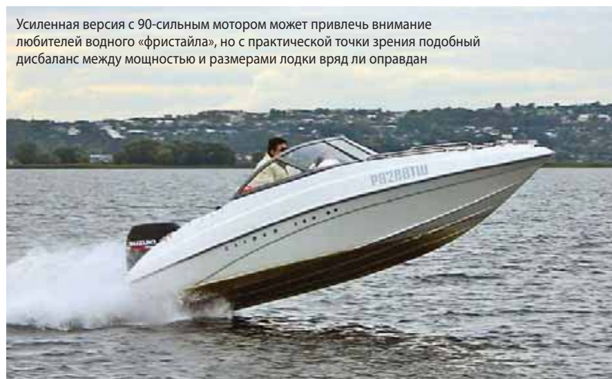
Усиленная версия с 90-сильным мотором может привлечь внимание любителей водного «фристайла», но с практической точки зрения подобный дисбаланс между мощностью и размерами лодки вряд ли оправдан