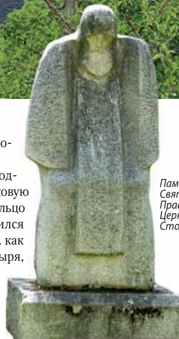
Памятник Святому Русской Православной Церкви Нилу Столбенскому

Большинство местных городков имеет богатейшую многовековую историю и входит в «Золотое кольцо России». Город Калязин появился на правом берегу Волги в XII в. как подворье Никольского монастыря, от которого нынче, после постройки в 1939 г. Угличской ГЭС, сохранилась только торчащая из водохранилища пяти-