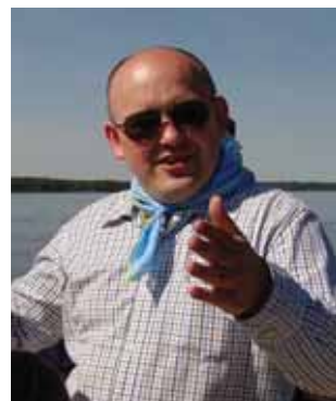
С.А.Аристов, вице-губернатор Твери

Но это уже совсем другая история, и к отлично организованному яхтенному событию прямого отношения не имеет. ■