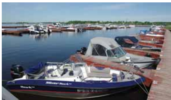
Плавучая заправка «Татнефти»