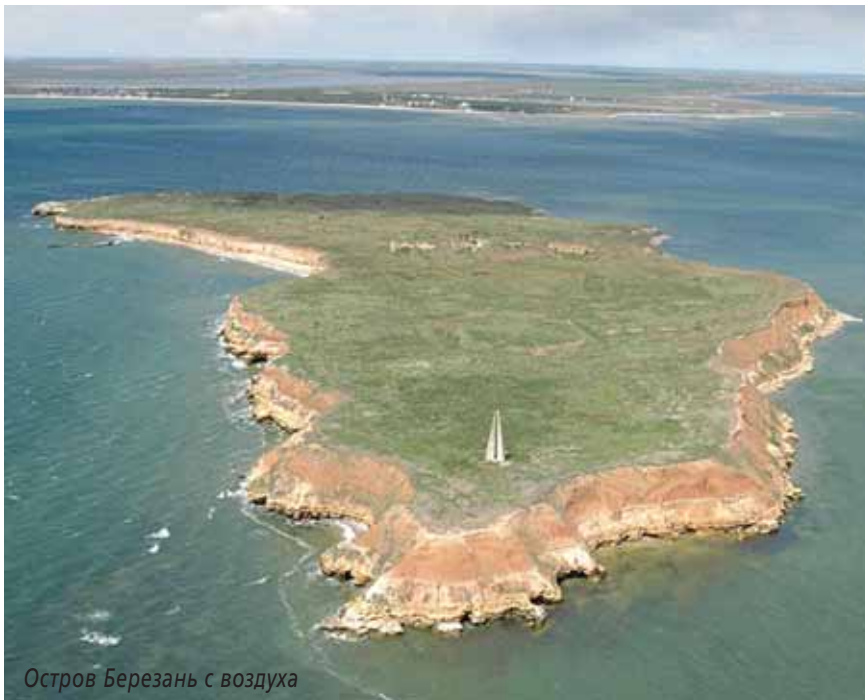
Остров Березань с воздуха