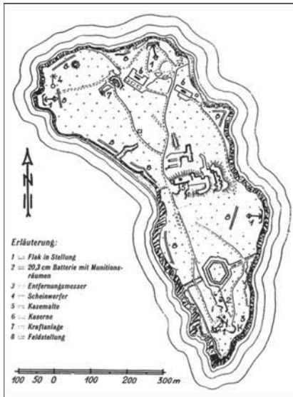
Немецкий план позиций 1942 г.