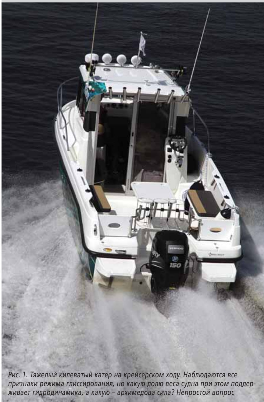
Рис. 1. Тяжелый килеватый катер на крейсерском ходу. Наблюдаются все признаки режима глиссирования, но какую долю веса судна при этом поддерживает гидродинамика, а какую – архимедова сила? Непростой вопрос

Алексей Даняев Популяризация судостроительной науки, на чьей ниве более полувека трудится и «Кия», сделала свое дело – широкие массы яхтсменов и водномоторников охотно оперируют терминами, в полной мере доступными, казалось бы, только специалистам, такими как «центр давлений», «число Фруда», «режим движения». Заметим, что за рубежами России такими вещами даже профильный журналист владеет далеко не всякий. Но все ли мы подразумеваем за терминами одни и те же понятия?