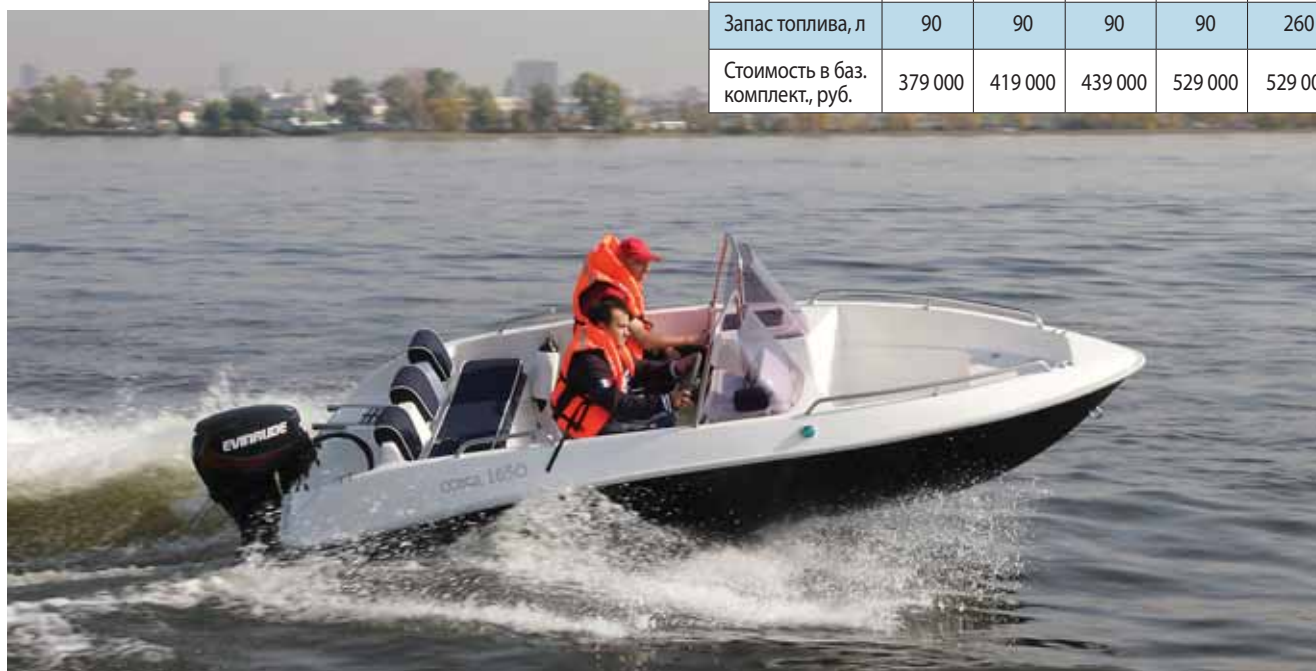
Меньшее удлинение корпуса и его относительно большой вес в сочетании с двухтактным мотором делают ход «16-й» более спортивным и жестким